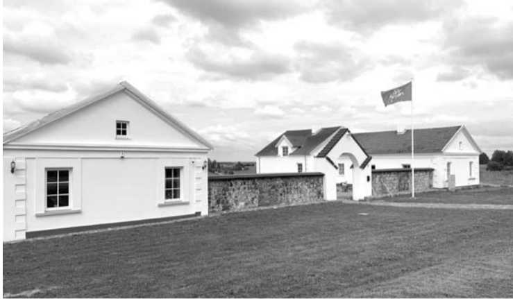
Staškūniškio pašto stoties pastatuose atsidarys užkandinė ir motelis.

Senajoje Kurklių seniūnijos Staškūniškio pašto stotyje planuojama atidaryti kavinę bei motelį. Istoriniai pastatai savo amžių skaičiuoja nuo 1834 metų, o šiuo metu jie prikeliami naujam gyvenimui.