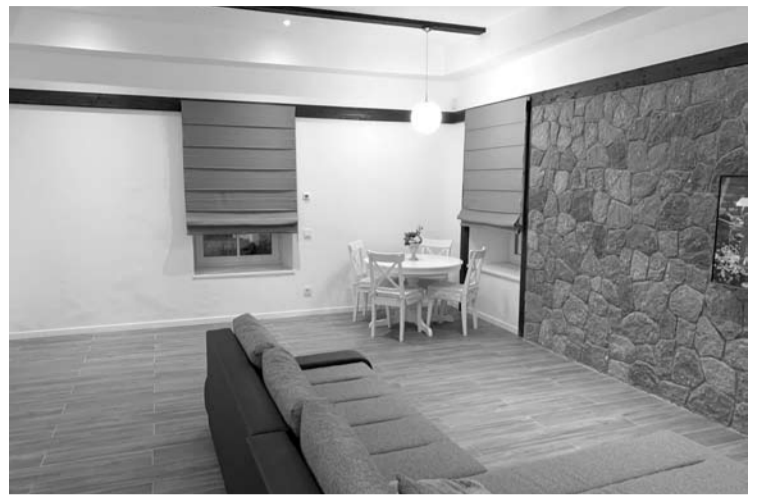
Žvilgsnis į renovuoto pastato vidų.