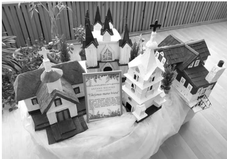
Parodos autorius Antanas Ralickas „Anykštai“ sakė, jog kūrė tu pastatų maketus, kurie geriausiai matomi pro globos namų kambario langą.

Pats A. Ralickas „Anykštai“ sakė, jog stengėsi atkurti tuos pastatus, kuriuos geriausiai mato pro globos namų langus. Kurti pastatų maketus jis pradėjo apsigyvenęs globos namuose. „Pasiūlė specialistės užsiimti. Po truputį, po truputį